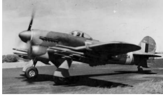
Vliegtuig type Typhoon